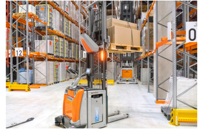
Automatik-Stapler, wie er bei Koch International im Lager Bramsche-Engter eingesetzt wird